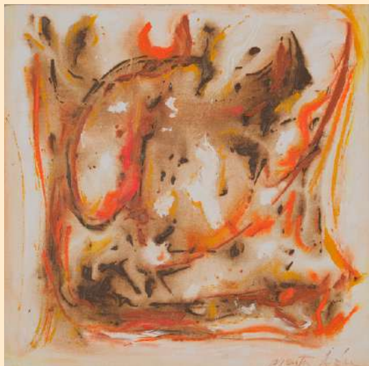
FICHA TECNICA DE LA OBRA.

OA3: Crear trabajos visuales a partir de diferentes desafíos creativos, usando medios de expresión contemporáneos como la instalación.