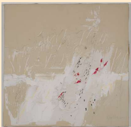
FICHA TECNICA DE LA OBRA.

Autora: Antonella Gallegos Davico. Obra: Sin Titulo. Año: Desconocido. Soporte: Técnica Mixta sobre tela.