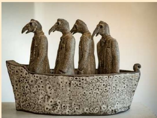
FICHA TECNICA DE LA OBRA.

OA3: Crear trabajos visuales a partir de la imaginación, experimentando con medios digitales de expresión contemporáneos como fotografía y edición de imágenes.