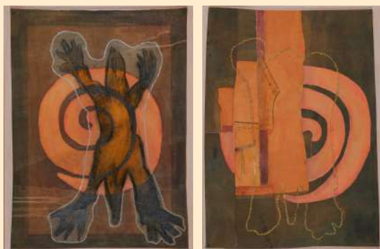
FICHA TÉCNICA DE LA OBRA.